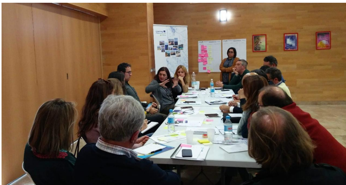
Roadshow Algeciras, 20 de febrero 2019