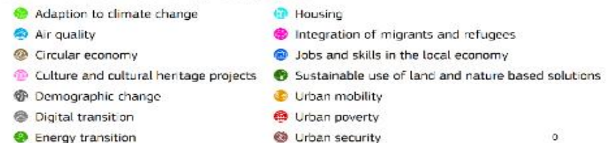
Urban Innovative Actions: Approved projects