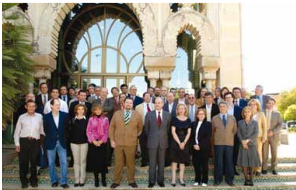
Reunión de constitución del Panel de Expertos para el asesoramiento y seguimiento del Plan Andaluz de Acción por el Clima, celebrada el 17 de abril de 2007.